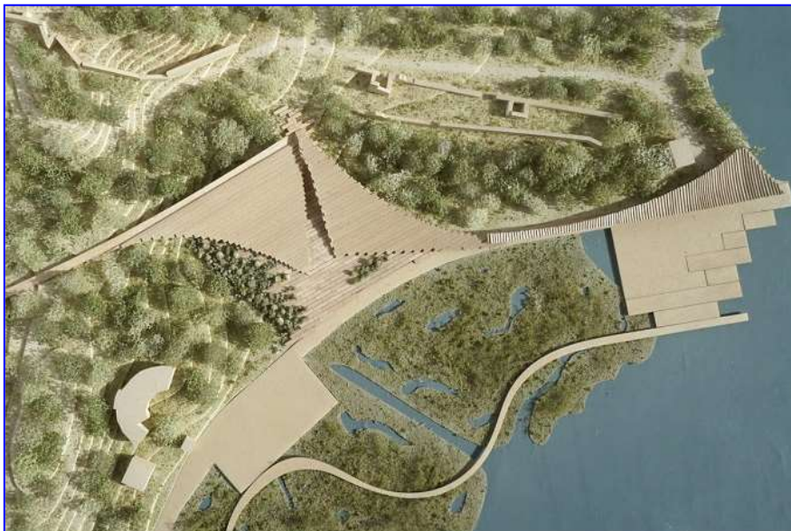
Projekti për zhvillimin e Parkut kombëtar të Butrintit

Është një hapësirë shumë e përcaktuar territoriale që lidhet me një ngjarje ose me një person historik ose