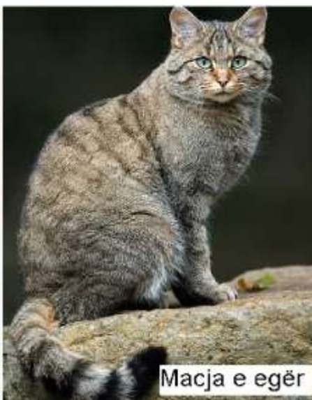
Macja e egër

Numri i popullatës së një lloji të faunës së egër rregullohet me mënyrat njerëzore, duke mbrojtur habitatet dhe duke mos u shkaktuar dëmtime llojeve të tjera të faunës së egër. Gjuetia dhe tregtimi i kafshëve duhet të kontrollohet nga strukturat përkatëse tëqeverisëe cila ka