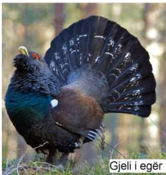
Gjeli i egër

Shtimi i popullatave të llojeve të faunës së egër mbahet nën kontroll dhe rregullohet për të siguruar mbrojtjen e shëndetit të popullatave të llojeve, mbrojtjen e llojeve të faunës së egër e shtëpiake nga sëmundjet, shmangien e dëmtimeve në bujqësi, në pyje dhe në përbërës të tjerë të mjedisit, të shkaktuara nga shtimi i pakontrolluar i këtyre popullatave.