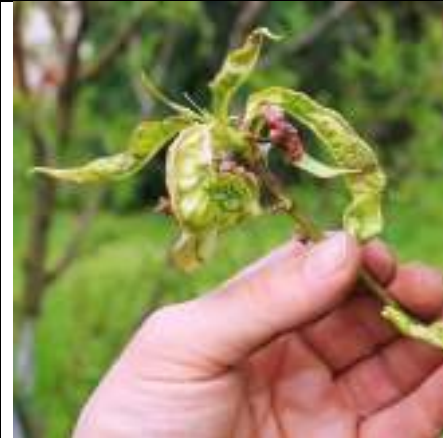
Figura 8. Identifikimi i sëmundjeve në pemët frutore nga nxënësit