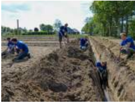
Figura 5. Instalimi i sistemit të vaditjes në një plantacion me arra nga nxënësit.