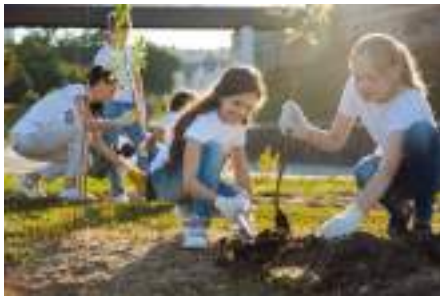
Figura 7. Mbjellja dhe plehërimi organik i drufrutorëve nga nxënësit.

Prezantoni teknologjinë e prodhimit të përdorur para mësuesve, nxënësve dhe palëve të tjera të interesuara.