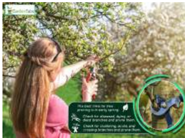
Figura 4. Krasitja e pemëve frutore nga nxënësit.