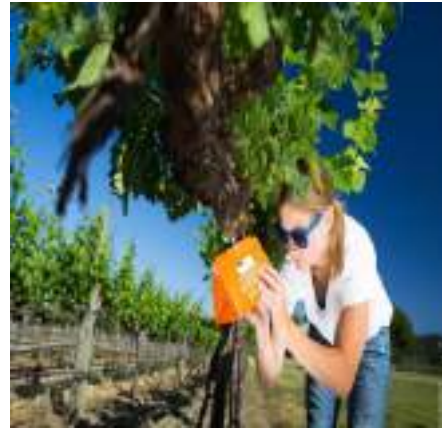
Figura 6. Menaxhimi i Integruar i dëmtuesve nga nxënësit.