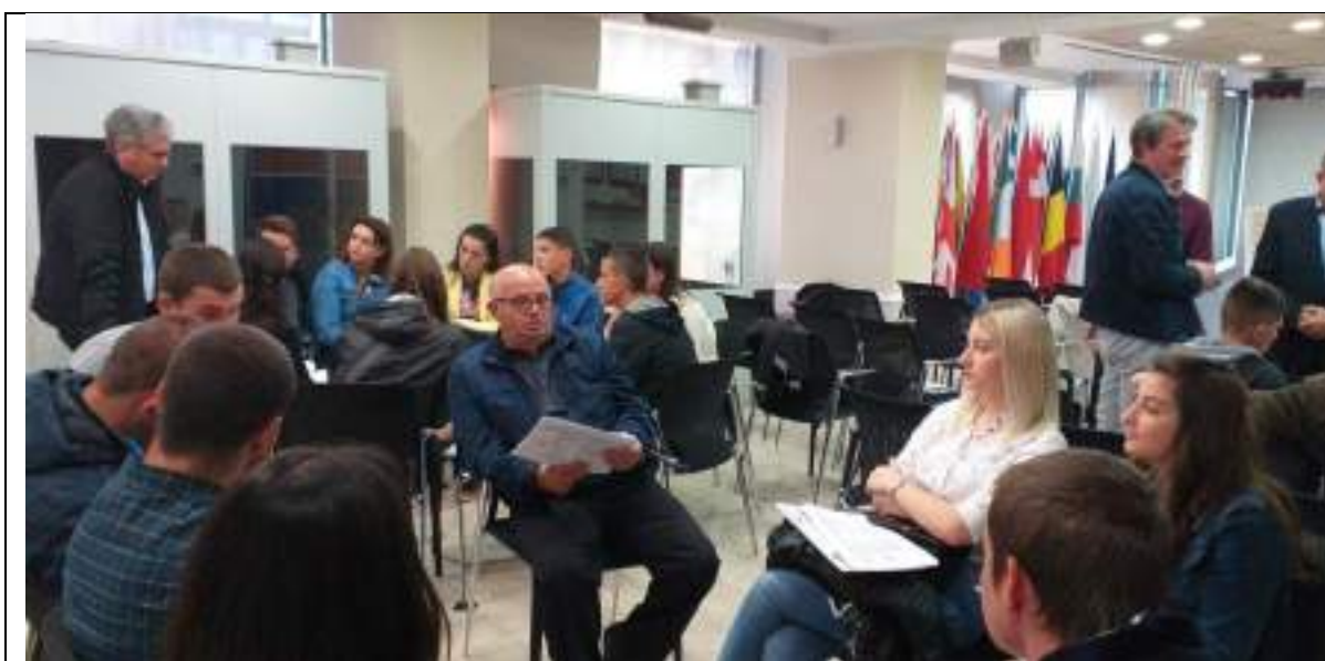
Figura 2: Orë mësimi interaktive