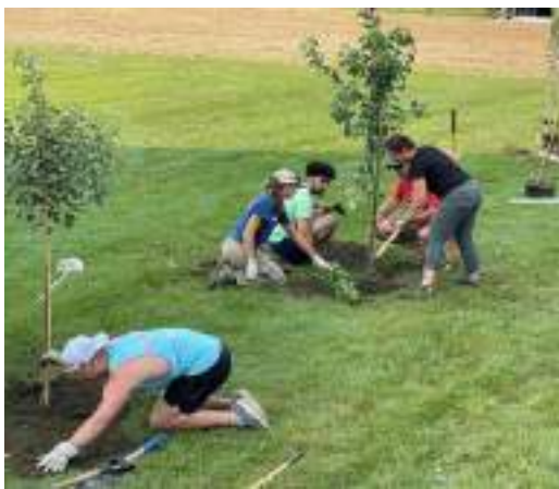
Figura 3. Mbjellja e pemëve frutore nga nxënësit.